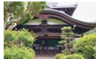
護国之道場 重厚感のある建築物です。