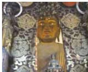
ご本尊は薬師如来坐像