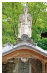
くめせんじん 久米仙人

久米仙人には面白い伝説があります。ある日仙人が仙術により空を飛んでいる時に川で洗濯をしている若い女性のふくらはぎに目がくらみ、神通力を失って墜落し、そこにお寺が建てられたといわれています。