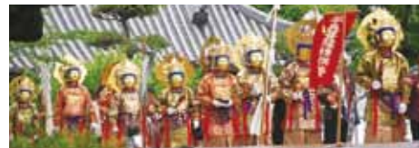
5月の練供養では護国之道場から本堂まで約100mの掛け橋が架けられ、現世と浄土をつなぐ来迎橋とみなして二十五菩薩が渡っていかれます。

久米仙人には面白い伝説があります。ある日仙人が仙術により空を飛んでいる時に川で洗濯をしている若い女性のふくらはぎに目がくらみ、神通力を失って墜落し、そこにお寺が建てられたといわれています。