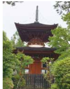
多宝塔(重要文化財) 京都の仁和寺より移築された桃山形式の美しい塔です。