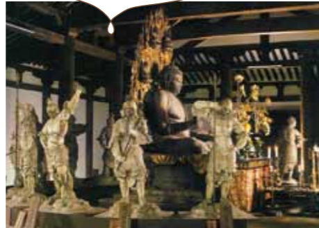
十二神将立像(国宝)奈良時代 十二神将はご本尊を囲むようにして護衛されています。日本最古最大の十二神将です。