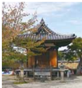
地藏堂(国指定重要文化財) 小さな仏堂建築で鎌倉時代の建物です。