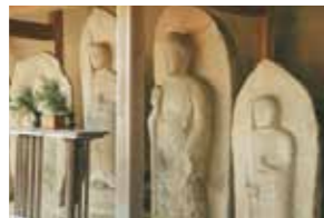
石仏群(奈良時代) 花崗岩でつくられた石仏が並べられています。