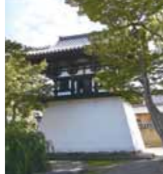
鐘楼(国指定重要文化財) 鎌倉時代後期の建立 内部にかかっている梵鐘は国指定重要文化財です。