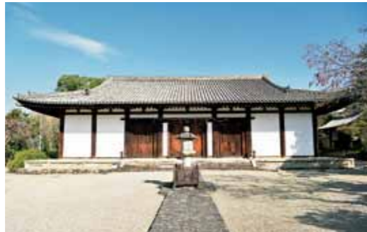
本堂(国宝)奈良時代 大屋根の曲線と白壁は創建当時の天平建築様式です。内部には天井がなく骨組みや円柱の柱が見えます。