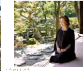
こうやくしじょう 香薬師堂 秘仏、おたま地藏・景清地藏尊(鎌倉時代)が安置されています。