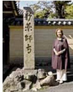
東門(国指定重要文化財) 鎌倉時代後期

創建当時の十二神将の色彩はこのように鮮やかだったそうで、今でも部分的に色が残っています。