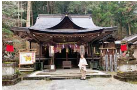
本殿(上津尾社) ご祭神は大日靈貴尊天照大御神様です。以前は鳥見山の山中にあったそうですが1112年に現在の地に建てられました。拝殿は1924年(大正13年)に新設されました。