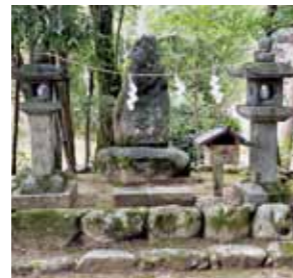
御祓殿石 祓い戸様のようです。