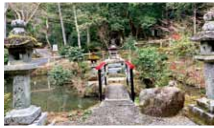
桃神池 手水舎の向かい側の池の中に、小さなお社が建っています。ご祭神は意富加牟豆美命様です。