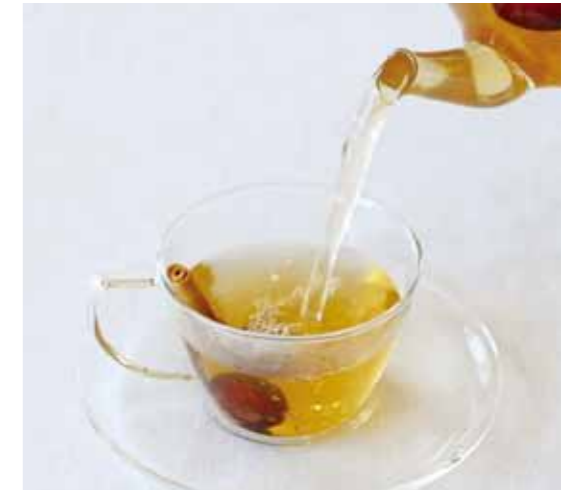
ナツメとシナモンの薬膳茶

作り方は、乾燥ナツメにエキスが出やすいように切り目を入れ10個ほどを1ℓの「はとむぎ茶」に加えます。10分ほど煮ると、ほんのり甘味のある美味しい薬膳茶ができます。お茶の中のナツメは甘酸っぱい味がして美味しいです。シナモンはカップに添えてスーッとした風味と香りもお楽しみください。好みを生姜とハチミツを少々入れても美味しいです。