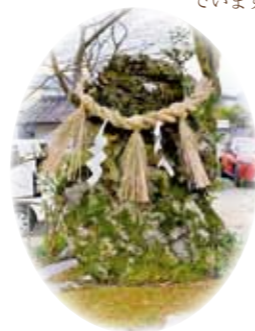
子寶石 鳥居をくぐると左手に子寶石が祀られています。