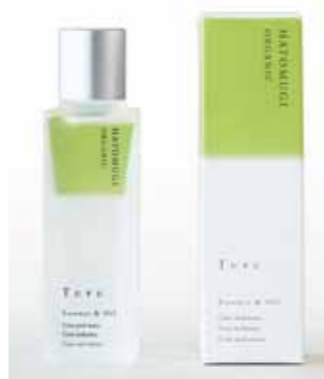
内容量:32ml 価格:4,420円(税込)