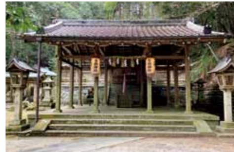
下津尾社 ご祭神は八幡大神様と春日大神様を祀られています。