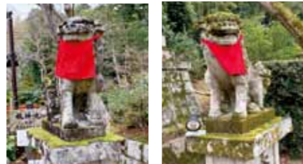
狛犬 砂岩性の狛犬がたくさんいます。みんな赤い涎掛けを掛けています。