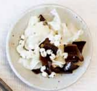
はとむぎと双耳(黒きくらげと白きくらげ)のニンニク炒め