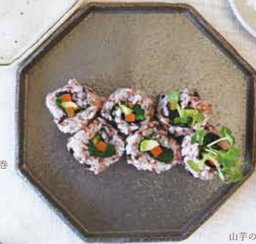
はとむぎと黒米の梅酢のカリフォルニア巻