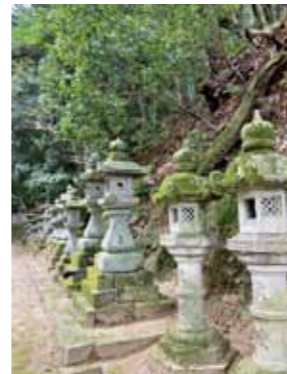
参道 昼間でも薄暗い参道。左右に苔むした160余りの石灯籠が並んでいます。