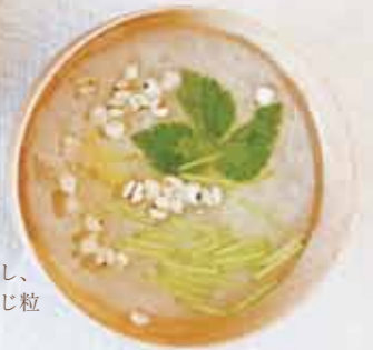
山芋のすり流し、はとむぎほうじ粒トッピング