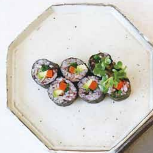
はとむぎと黒米の梅酢の野菜巻