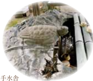
手水舎 亀頭という亀に似た石像からお水が出ています。珍しいですね。