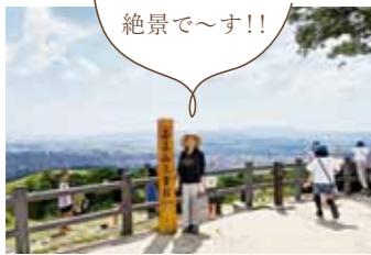
若草山三重目到着 頂上では右に葛城山、大和三山、正面に生駒山、そして眼下に平城旧跡など奈良盆地一帯が見渡せます。そしてここから見る奈良の夜景は、新日本三大夜景の一つに認定されています。