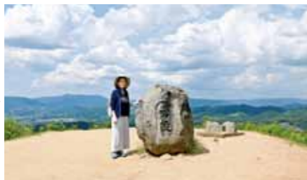
鶯塚古墳(前方後円墳) 三重目の山頂にある鶯塚古墳の被葬者は分かっていませんが、山の頂にあるのは全国的にも珍しいそうです。