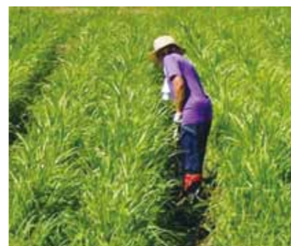
夕日を浴びながら、鍬で除草しています。

背丈の短い時に、カルチ(土寄せ)をかけます。カルチをかけることで畝の雑草を取り除き、ハトムギの生育を助けます。