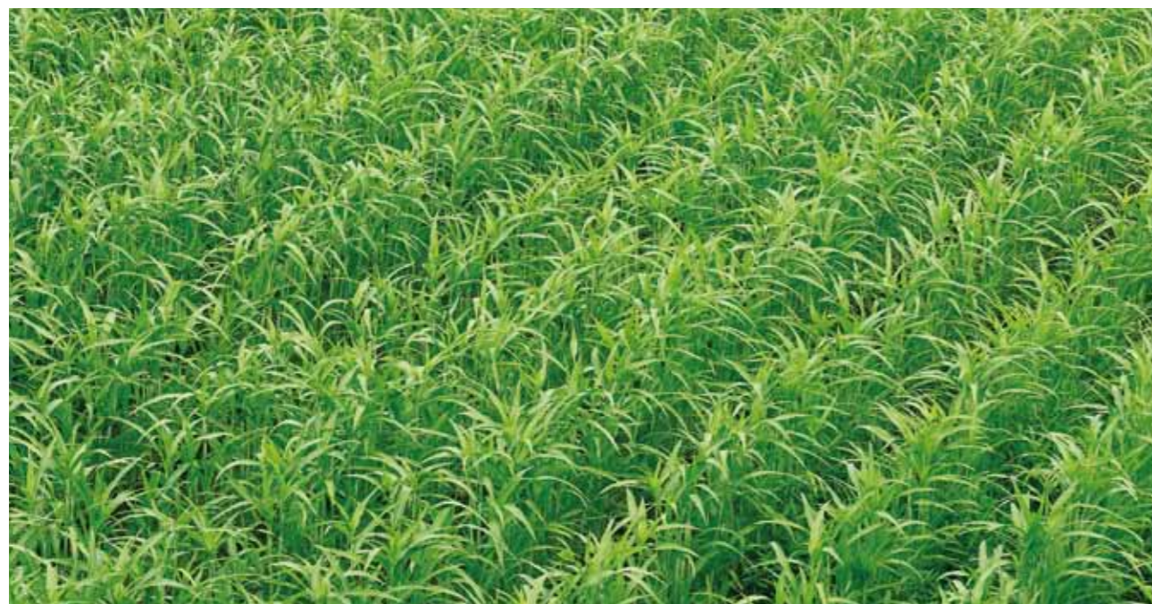
青々と成長したはとむぎ畑

の若葉が歌いながら踊っているよう！ 天雨の恵みと太陽のエネルギーをいっぱい受けて日々成長する姿は頼もしい青年のようです。