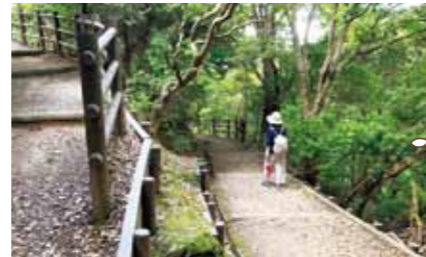
北ルートから下山 帰りは北ルートから下山しました。北ルートは南ルートとは違い森の中。ヘアピンカーブの階段を下ります。