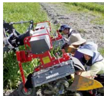
ハイクリトラクターにカルチの備品を取りつけています。