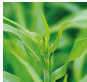
先に植えた畑では出穂が見られます。