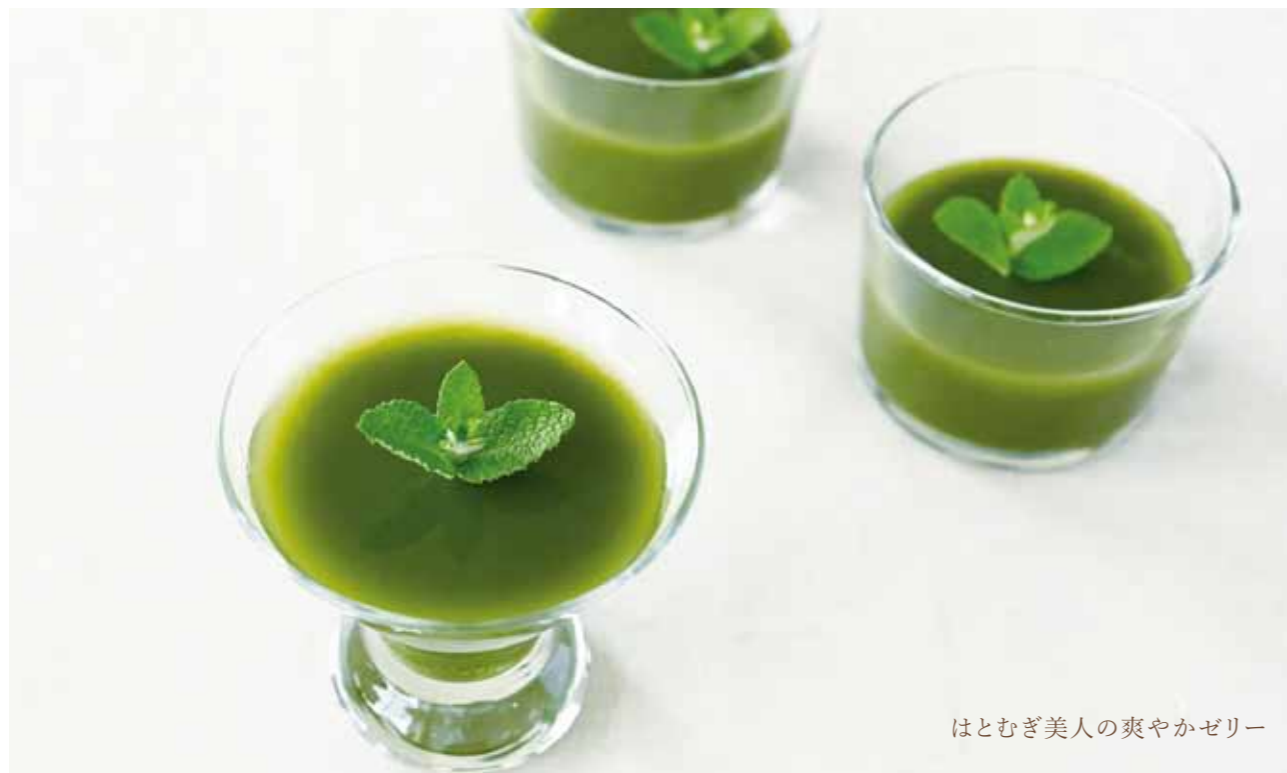
はとむぎ美人の爽やかゼリー

今回はビタミン・ミネラルを豊富に含んでいる抹茶と「有機はとむぎ若葉の青汁」そして「はとむぎ美人」を使って美味しくて爽やかなゼリーをつくりました。それぞれの材料には老化を予防する強い抗酸化力を持っているため、夏の肌ダメージをリセットしてくれます。