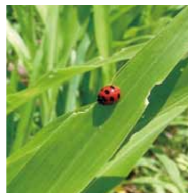
はとむぎ若葉と、てんとう虫。

冷たいはとむぎ茶が美味しい季節になりました。ほてった体の熱を取り除いてくれるはとむぎ茶はノンカフェインなので赤ちゃんから飲むことができます。そして赤ちゃんやお子様のあせも、水いぼにもいいので夏の飲み物としてご家族揃って活用してください。