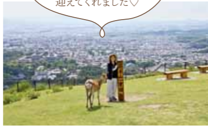
若草山一重目 若草山は一重目、二重目、三重目と呼ばれます。一重目の頂上から奈良市街が一望できます。