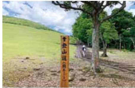
南ルート 南ルートは開放的でなだらかな階段が続きます。