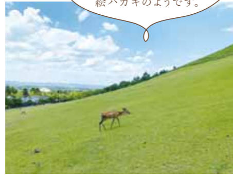
開放的な登山道 南ルートの登山道は若草山を横に見ながら登ります。