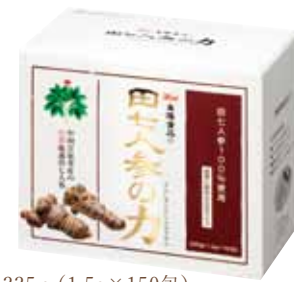
225g (1.5g×150包) 価格 29,322円(税込)