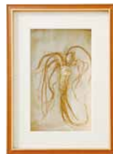
雲南省の畑で栽培された田七人參、サイズは18cm~20cmほどの特大です。