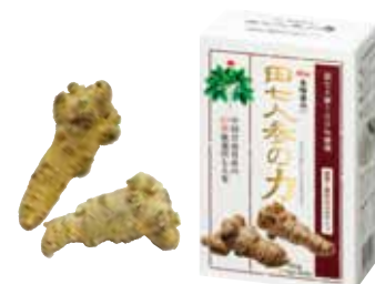
60g (1.5g×40包) 価格 9,504円(税込)

*頭級とは、500gに何個の田七人參が含まれるかの単位です。(40個で500gあれば40)