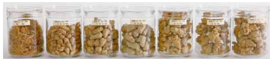
田七人參の頭級別比較

田七人參は中国の雲南省、海拔約1000m~2000mの限られた地域で栽培されています。昔からお金に換えられないほど貴重な人參として「金不換」と呼ばれる秘薬です。田七人參の成分は、デンシチン、田七サポニン、田七ケトン、アルギニン、有機ゲルマニウムなどを含み、これらの成分は肝機能を高める、血中コレステロールの減少、血液の循環を促進して心臓の負担を減少させたりします。また免疫力を向上させることで生活習慣病の予防や滋養強壮、疲労回復、肩こりの改善などに期待できます。