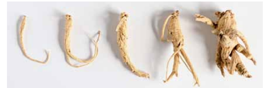
高麗人參(乾燥)のサイズ