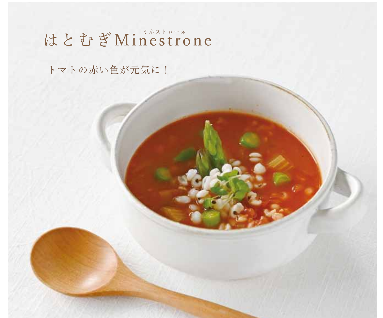
「はとむぎ美人」と「はとむぎグラノーラ」で美味しく春のデトックス