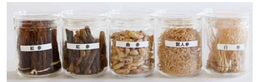
高麗人參(乾燥)の仲間たち