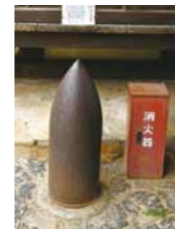
砲弾(境内に設置されています) 戦艦「鎮遠」主砲30.5センチ砲弾と書いてあります。