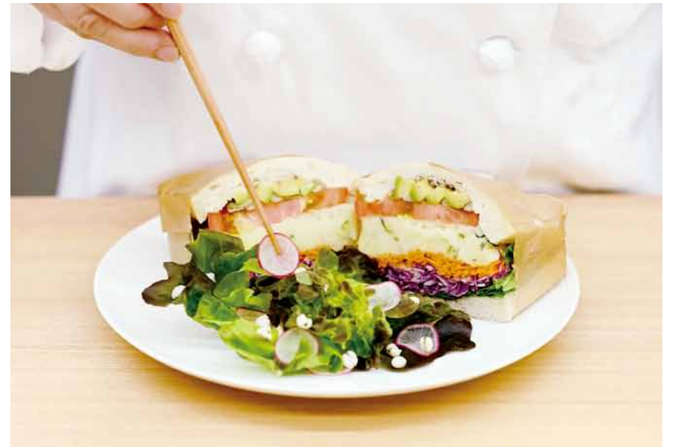
薬膳料理教室の様子