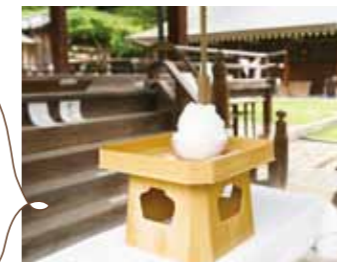
献氷り 純水のかき水をお供えて参拝してきました。300円以上を賽銭箱にご奉賽すると氷が頂けます。