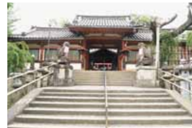
表門・東西廊 1402年に旧御所から寄贈された日華門だそうです。