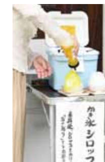
献氷の後は、セルフで蜜をかけていただきます。