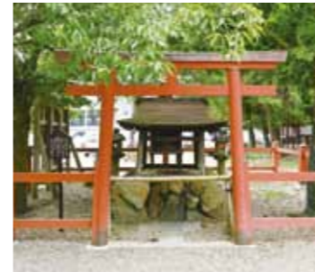
祓所 住吉神社 罪、けがれや災などを除き、清め払いの神様です。