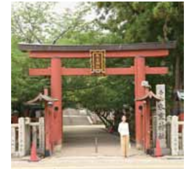
鳥居 東大寺の手前に位置しています。

奈良公園内にある氷の神様として知られる氷室神社へ行きました。氷室神社の由緒は「氷室神社縁起」絵巻や「続日本紀」に記載されており、天皇に氷を初めて献氷したという歴史があります。奈良時代、奈良公園内に氷室を設け、氷室をお守りくださる神様が祀られました。天皇に喜んでいただくため、冬に氷をつくり夏に使うという気の長い行事があったということ、その時代の人々の天皇に尽くすという純粋な心「誠」を感じます。現代では冷蔵・冷凍技術の恩恵にあずかって暮らせることに感謝ですね。