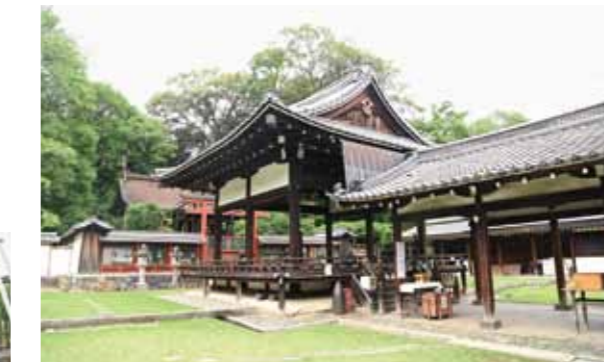
本殿・拝殿 おおさぎのみこと つげのいたぎおおやまぬしのみこと ぬかたのおおかつひのみこと ご祭神は大鷲鸕命、鬮鷄稲置大山主命、額田大仲彦命です。