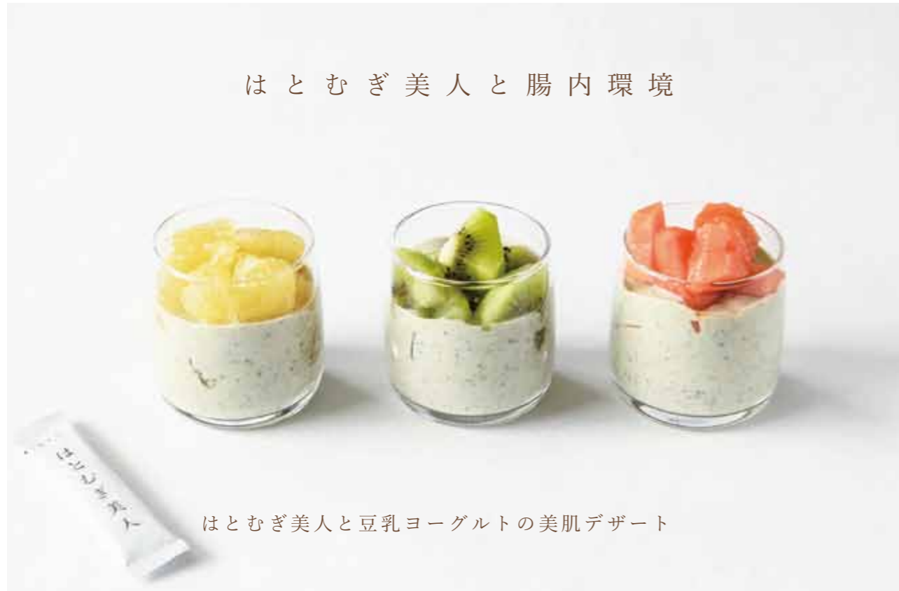
はとむぎ美人と豆乳ヨーグルトの美肌デザート